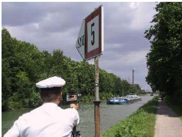
Geschwindigkeitsmessung mittels Laser-Meßverfahren.

In der nachfolgenden Tabelle finden Sie Regelsätze, die von der Wasserschutzpolizei Nordrhein-Westfalen für die Erhebung von Verwarngeldern angewendet werden: